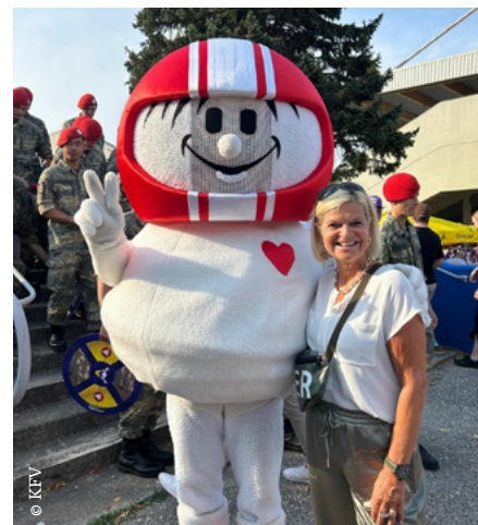
Stets Österreichs Sicherheit im Blick: Bundesministerin Mag. Klaudia Tanner und HELMI.