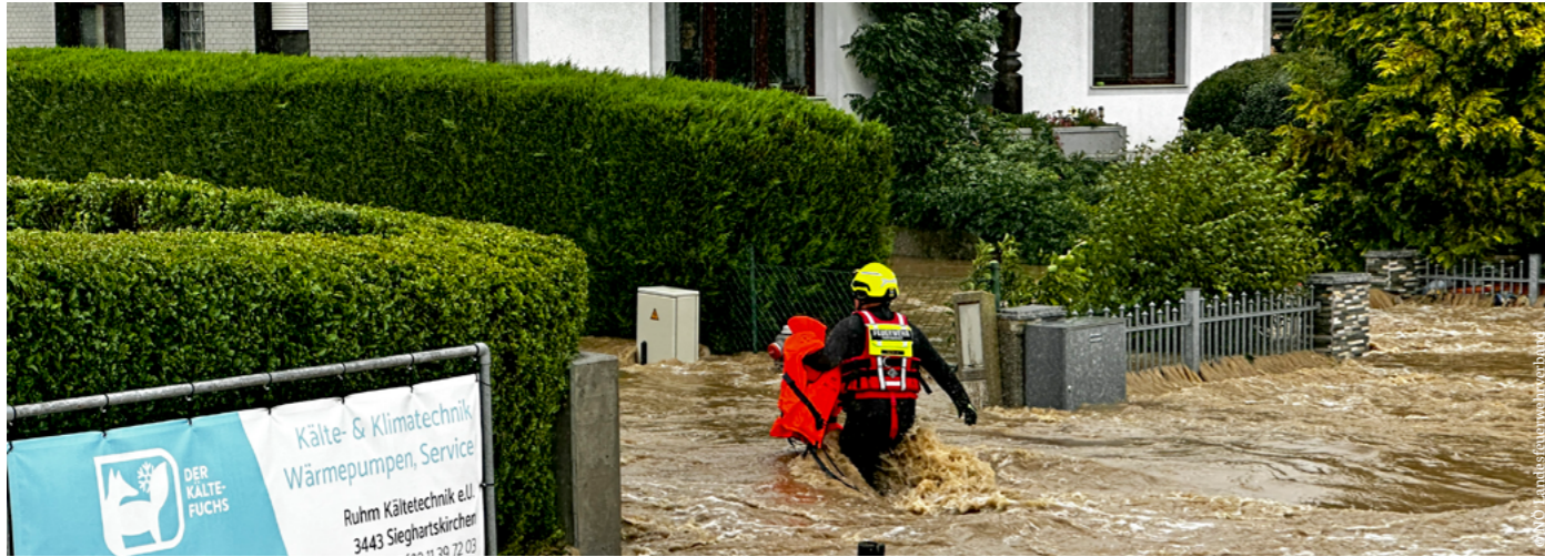
Das Jahrhunderthochwasser in Niederösterreich im Herbst 2024 traf viele Menschen unvorbereitet.