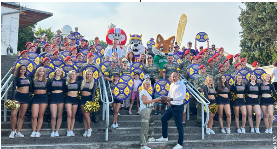
HELMi war Teil der einzigartigen Stimmung bei den Spielen der Vienna Vikings.

ihre Erfahrung im Leistungssport. Ziel der Partnerschaft ist es, einen Beitrag zur zukunftsorientierten und evidenzbasierten Sicherheitskultur zu leisten.