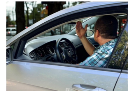
Wenn im Straßenverkehr die Nerven blank liegen, machen viele ihrem Ärger lautstark Luft.

Im Straßenverkehr Österreichs sind Konflikte keine Seltenheit. Eine aktuelle Befragung der Präventionsinstitution KFV hat herausgefunden, was die Menschen im Verkehrsgeschehen am meisten in Rage bringt.