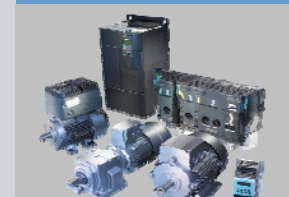
ELIN EBG Traction